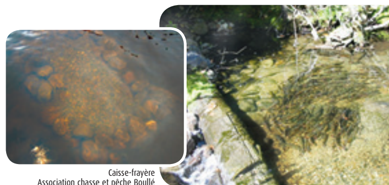
Caisse-frayère Association chasse et pêche Boullé