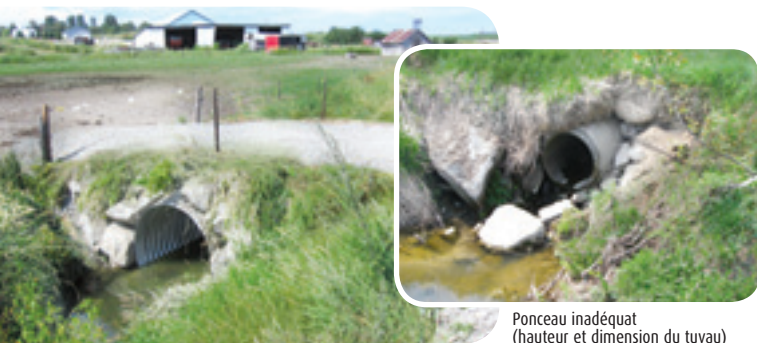
Ponceau bien aménagé Projet ruisseau Morin

Buts visés • En plus de corriger les problèmes d'érosion et d'écoulement d'eau, la réfection de ponceau permet la libre circulation des poissons et redonne accès à des habitats situés en amont du ponceau. Afin de préserver les conditions naturelles d'écoulement de l'eau, l'utilisation de structures à portée libre (ponts, passerelles) et les ponceaux en arche sont préférables à l'implantation de ponceaux fermés (tuyaux), qui sont illustrés dans les exemples qui suivent.