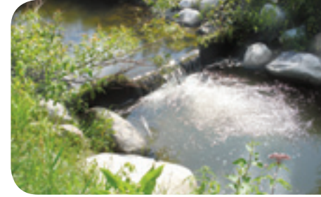
Projet rivière Boyer Sud

Un petit seuil en bois ou en enrochement permet la création de fosses et de petites chutes, qui deviennent des sites d'alimentation et de repos. Pour être franchissable par les ombles de toutes tailles, la hauteur du seuil ne doit pas excéder 30 cm.