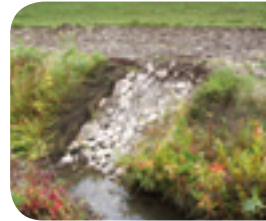
Projet rivière Fouquette

Divers ouvrages hydro-agricoles (chutes enrochées, avaloirs, etc.) permettent de limiter la perte de sol vers le cours d'eau. Ils sont un complément aux pratiques de conservation des sols et aux bandes riveraines.