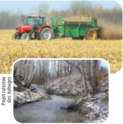
Projet ruisseau des Aulnages

La gestion optimale des fertilisants et des pesticides permet de minimiser l'apport de composés non désirables dans les cours d'eau.