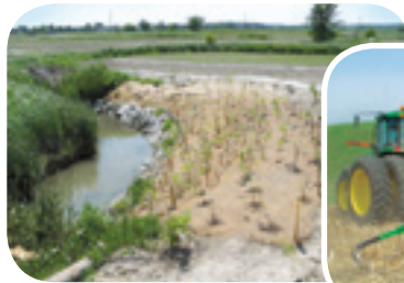
Projet ruisseau Richer

Le nivellement et la plantation de végétaux dans les berges sensibles à l'érosion permettent de les stabiliser de façon efficace. Un enrochement en pied de talus est parfois requis.