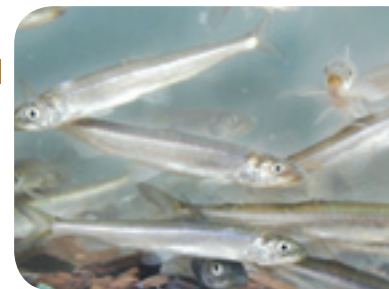
Éperlans arc-en-ciel Guy Trenchia/MRNF

La rivière Fouquette abrite l'une des quatre frayères d'éperlan arc-en-ciel du sud de l'estuaire du Saint-Laurent. Les actions menées pour réduire l'érosion dans le bassin versant de la rivière Fouquette s'ajoutent aux initiatives mises de l'avant pour assurer sa préservation.