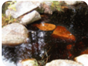
Association chasse et pêche Boullé

Un abri bien aménagé imite les structures naturelles retrouvées dans un cours d'eau en bonne condition, comme des pierres et des troncs d'arbres.