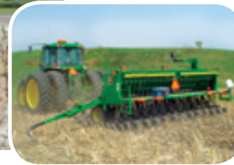
Projet rivière Niagarette