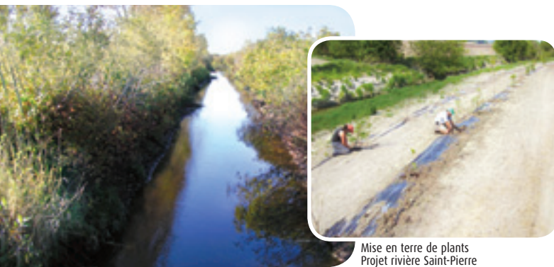
Bande riveraine implantée depuis 15 ans Projet rivière Fouquette

Producteur agricole Comité de bassin du projet ruisseau des Aulnages