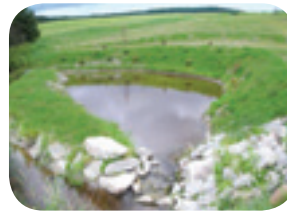
Projet rivière Niagarette

Ces bassins permettent d'absorber une partie des eaux de crue et de diminuer la force érosive sur les berges et le fond.