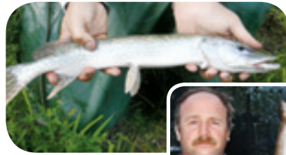
Grand brochet Projet ruisseau Richer

ment le fouille-roche gris et le méné laiton, des espèces en situation précaire de la plaine du Saint-Laurent. La survie de ces espèces dépend à la fois de la qualité des eaux et de la préservation de leurs habitats.