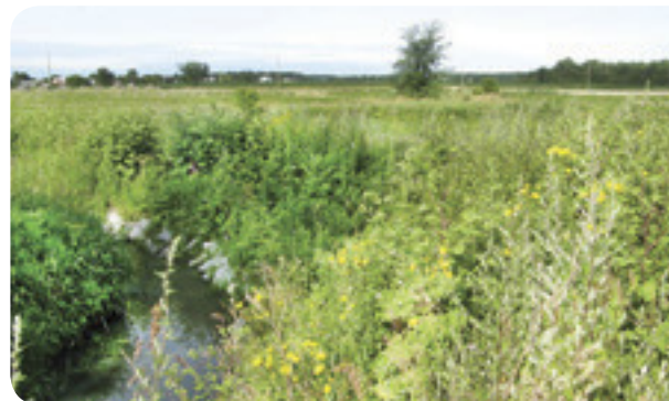
Berges stabilisées après 2 ans - Projet ruisseau Richer

Entretien et recommandations • Les berges stabilisées et le lit du cours d'eau doivent être inspectés régulièrement afin d'en vérifier la stabilité et de prévenir l'érosion. Ces aménagements doivent être planifiés et réalisés avec la collaboration d'un spécialiste afin d'en assurer l'efficacité, la durabilité et l'obtention des permis nécessaires.