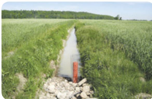
Fossé avaloir « adapté » - Projet ruisseau Richer

Entretien et recommandations • Il est recommandé de vérifier le niveau de l'eau durant les premières années, surtout au moment du dégel printanier et lors de fortes précipitations, afin de s'assurer que l'avaloir évacue adéquatement l'eau. Il faut également s'assurer que l'eau se maintient suffisamment longtemps dans le fossé pour permettre aux espèces présentes de terminer leur cycle de reproduction.