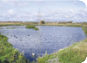
Projet rivière Boyer Sud

Des étangs peuvent être aménagés de façon permanente dans les milieux où le drainage est mauvais et donc moins propice à la culture. Ils fourniront des sites de repos, d'alimentation et de reproduction pour plusieurs espèces.