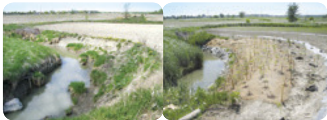
À GAUCHE - Problèmes d'érosion Projet ruisseau Richer À DROITE - Travaux de reprofilage et stabilisation Projet ruisseau Richer

Description • Le profilage des berges en pente douce et la plantation de végétaux dans les berges sensibles à l'érosion permettent de les stabiliser. Un enrochement en pied de talus est parfois requis. L'enrochement peut toutefois occasionner une augmentation de la température de l'eau et affecter les déplacements des amphibiens et des reptiles. L'utilisation de végétaux leur procure des abris contre les prédateurs et des sites d'alimentation.