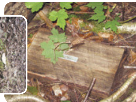
Planchettes de bois servant d'abris pour les salamandres Projet rivière Boyer Sud