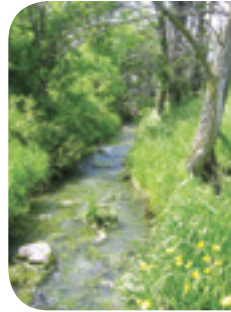
Projet rivière Saint-Pierre

Les arbres et les arbustes en bande riveraine fournissent de l'ombre au cours d'eau et permettent d'abaisser la température de l'eau. La diversité d'insectes est alors augmentée, procurant ainsi un site d'alimentation intéressant pour plusieurs espèces, qui peuvent aussi s'y réfugier, à l'abri des prédateurs.