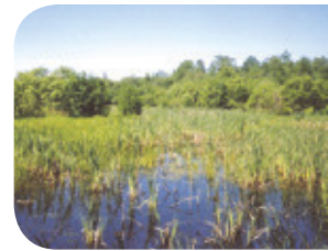
Projet rivière des Envies

Les marais, marécages et étangs sont des habitats riches en biodiversité. Ils constituent un excellent garde-manger pour les amphibiens et les reptiles, tout en leur offrant de bons sites de reproduction et d'hibernation.