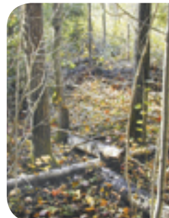
Projet rivière Fouquette

En laissant les débris ligneux, les souches et les pierres en bordure des champs, dans les boisés ou dans les milieux humides, on offre des abris naturels et des sites de repos pour plusieurs espèces. Dans les lacs et les étangs, il est recommandé de laisser des troncs d'arbres flottants, qui seront utilisés par les tortues et les grenouilles.