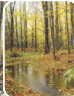
Projet rivière Boyer Sud