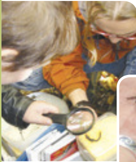
Salamandre cendrée Projet rivière Boyer Sud

Le milieu agricole offre une grande diversité d'habitats pour les reptiles (couleuvres, tortues) et les amphibiens (salamandres, grenouilles, crapauds, rainettes). Ils peuvent être bénéfiques pour l'agriculture, puisqu'ils se nourrissent d'une variété d'insectes et de petits invertébrés comme les limaces.