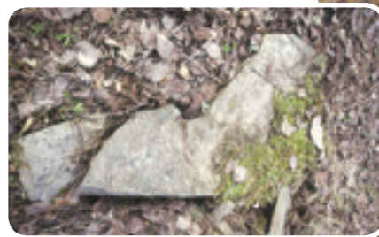
Parterre forestier avec abris pour les couleuvres

Entretien et recommandations • Les abris aménagés nécessitent très peu d'entretien. Leur stabilité devra être vérifiée à l'occasion. En forêt, à la suite de travaux de coupe, il est recommandé de laisser des débris ligneux au sol et des pierres, puisqu'ils servent d'abris à plusieurs espèces.