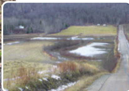
Étang temporaire dans un champ Projet rivière des Envies