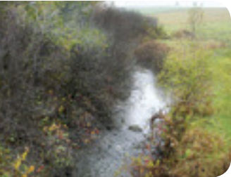
Aulnaie - Projet rivière Fouquette

Les friches et les aulnaies (bosquets d'arbustes d'aulnes) sont des milieux très fréquentés par la tortue des bois et les couleuvres. La conservation de ces milieux permet de maintenir des zones d'alimentation, des abris et des endroits pour réguler la température corporelle de ces reptiles.