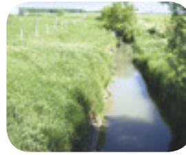
Projet ruisseau des Aulnages

Le fauchage des herbacées le long des fossés doit être évité afin de conserver une bonne humidité au sol. De plus, les bandes riveraines enherbées fournissent des abris et des sites d'alimentation pour plusieurs espèces.