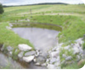
Projet rivière Niagarette

Les bassins permettent d'absorber une partie des eaux de crues et de diminuer la force érosive sur les berges et le fond. Ils créent des sites de reproduction et d'alimentation pour les amphibiens et les reptiles.