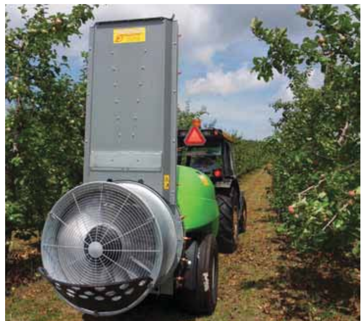
Pulvérisateur à jet porté