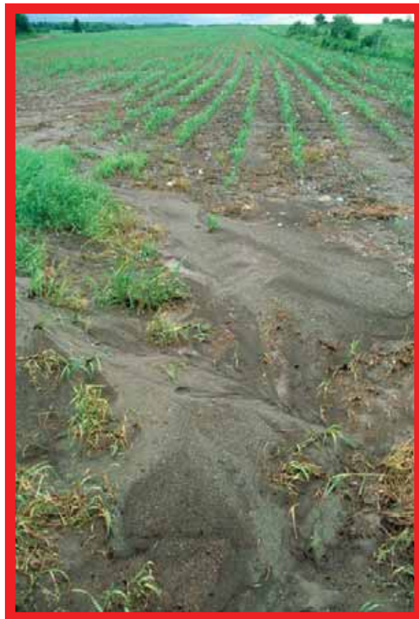
RUISSELLEMENT ENTRAÎNANT DES SÉDIMENTS