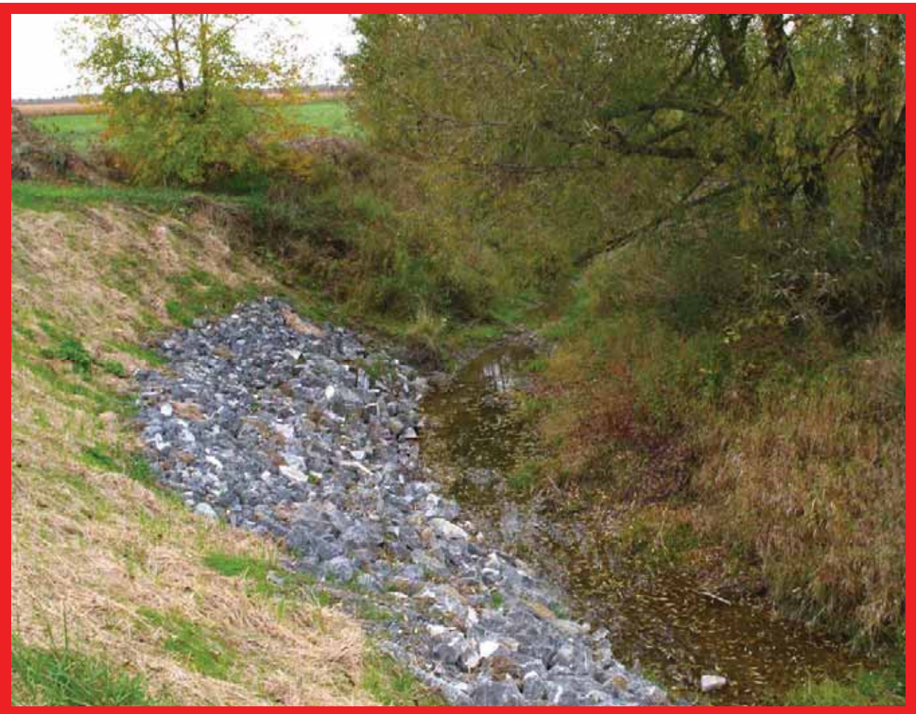
ADOUCCISSEMENT DE TALUS ET STABILISATION PAR PERRÉ

Si le talus a déjà cédé, on peut appliquer quand même cette procédure pour stopper tout autre mouvement de sol et éviter que le processus d'instabilité ne s'amplifie.