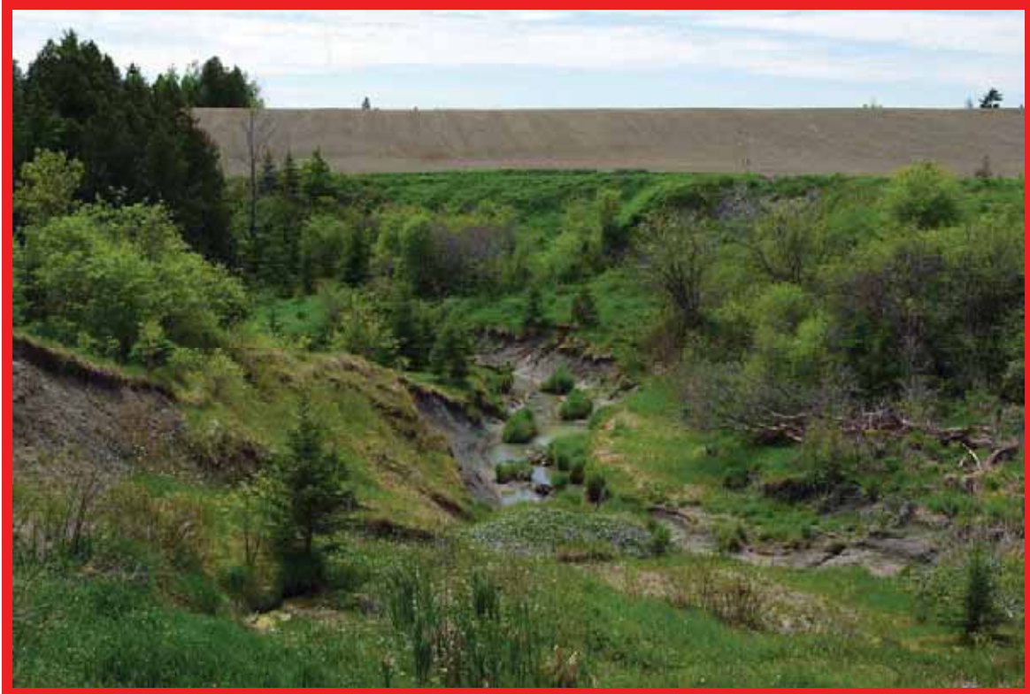
DÉGRADATION SYSTÉMIQUE D'UN COURS D'EAU

Lorsque de longs tronçons de cours d'eau sont dégradés par l'érosion, les causes de ces processus doivent être expliquées et des mesures correctrices mises de l'avant.