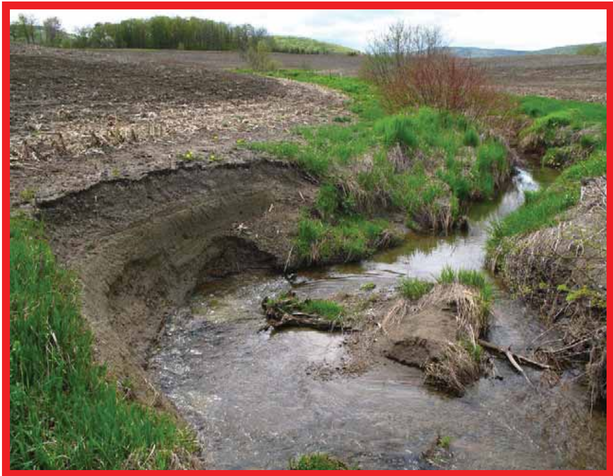
RUPTURE EN CERCLE ASSOCIÉE À UN SAPEMENT DE BERGE

On ne constate habituellement ce phénomène qu'après la rupture du talus, rarement avant. Si on a la possibilité d'observer de la fissuration et de légers mouvements de sol au préalable, il peut quand même être risqué d'intervenir avec des pelles hydrauliques ou d'autres équipements motorisés en raison de leur poids important et des vibrations que leur fonctionnement engendre. Lorsqu'une masse d'argile sensible est soumise à des vibrations à basse fréquence, elle a le potentiel de se liquéfier, ce qui peut provoquer un effondrement subit et causer des dommages considérables.