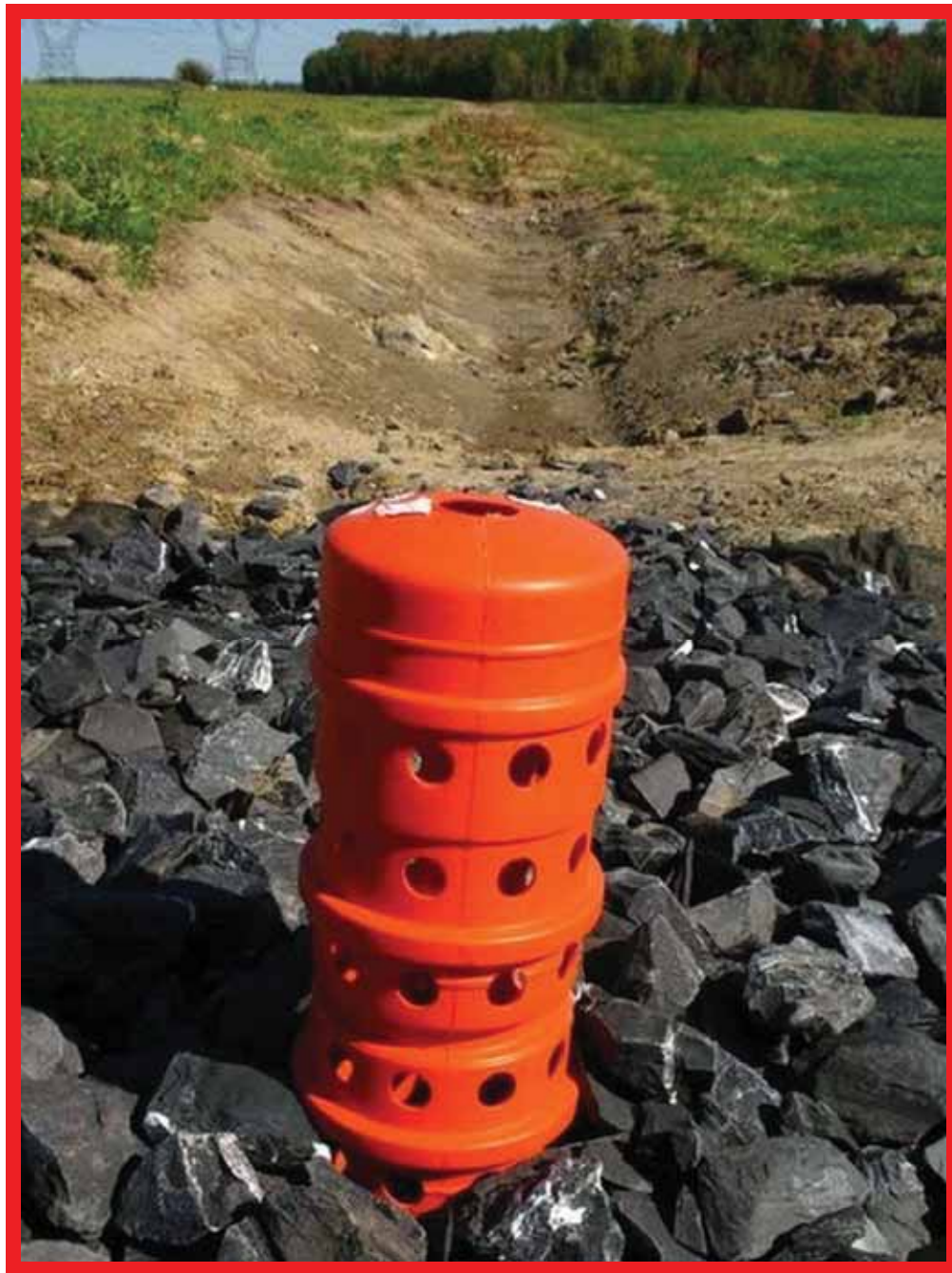
INTERCEPTION D'EAU PAR AVALOIR