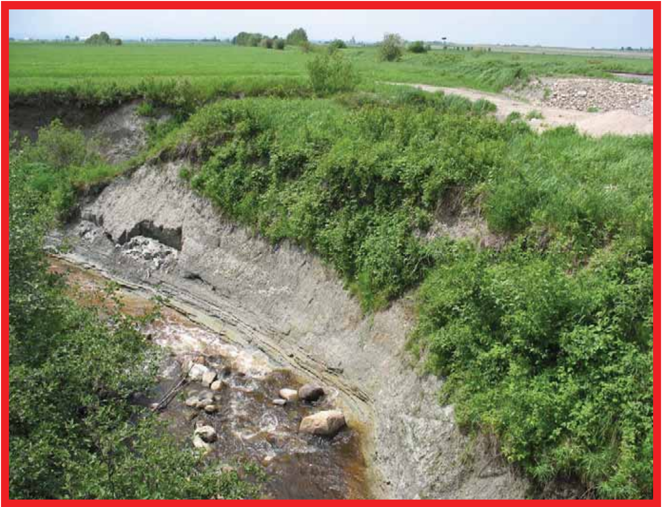
RÉGRESSION DE FOND CRÉANT DE L'INSTABILITÉ

La régression de fond est causée par une érosion survenant au niveau du fond du lit d'un cours d'eau. Dès que les vitesses d'eau dépassent 1,0 m/s, le matériel meuble du fond est arraché et transporté par l'écoulement. Le phénomène se produit principalement lors des crues, au moment où la hauteur de la lame d'eau, et par conséquent les forces tractrices, sont maximales. On assiste alors à un approfondissement subit ou progressif du lit qui peut se creuser de plusieurs mètres et entraîner l'instabilité des berges et des talus.