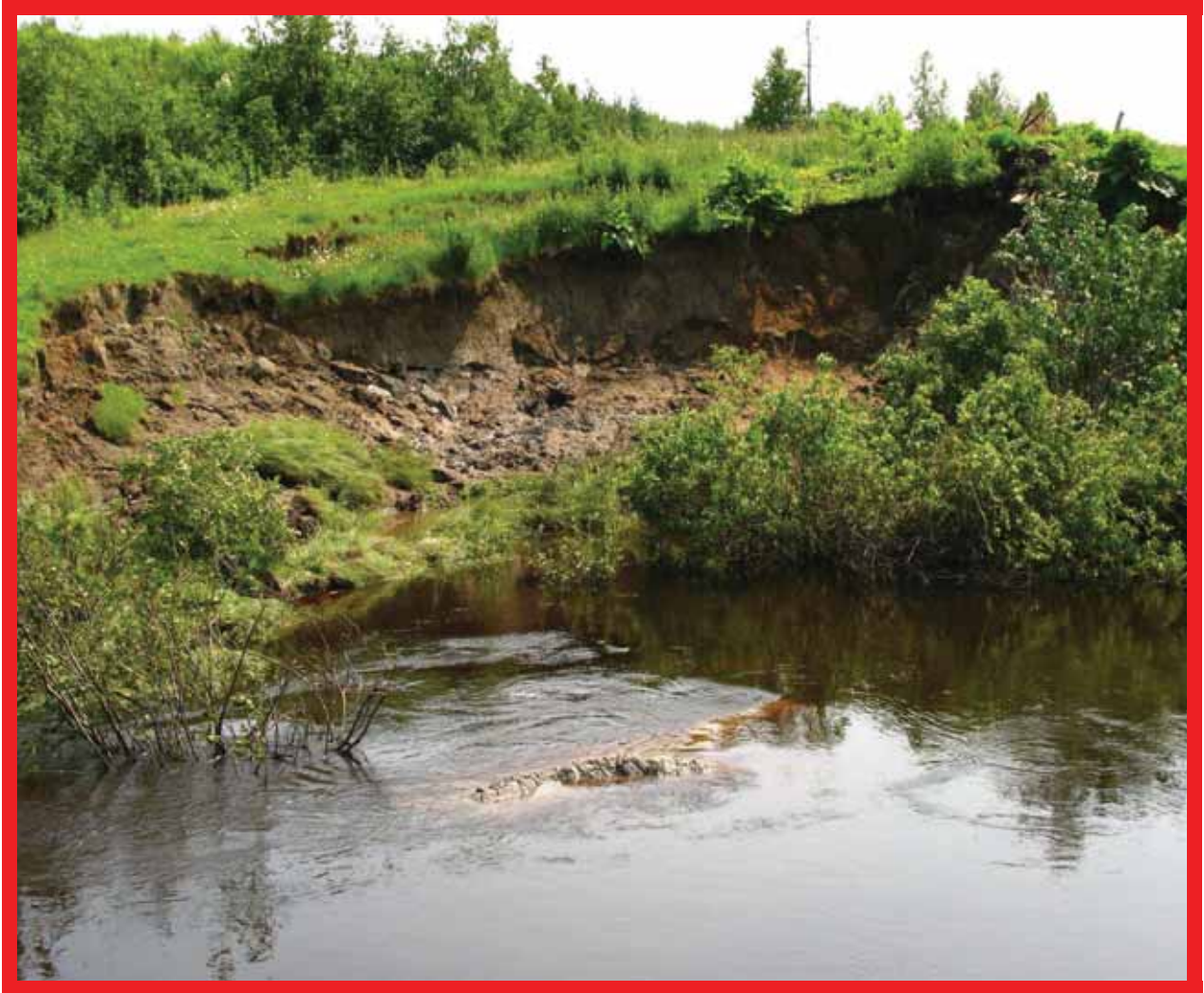
EFFONDREMENT DE TALUS PAR RUPTURE EN CERCLE

La rupture en cercle est un mécanisme d'affaissement de talus propre aux sols argileux possédant un mauvais drainage interne. La perméabilité de ces sols cohésifs est très faible, souvent de l'ordre de 1 \times 10^{-6} \text{ cm/sec} ou moins, de sorte que des pressions hydrauliques interstitielles se créent et contribuent à déstabiliser la masse de sol. La nappe phréatique se maintient profondément dans le sol à l'interface de deux couches de perméabilité différente et crée un plan de lubrification provoquant la rotation du talus.