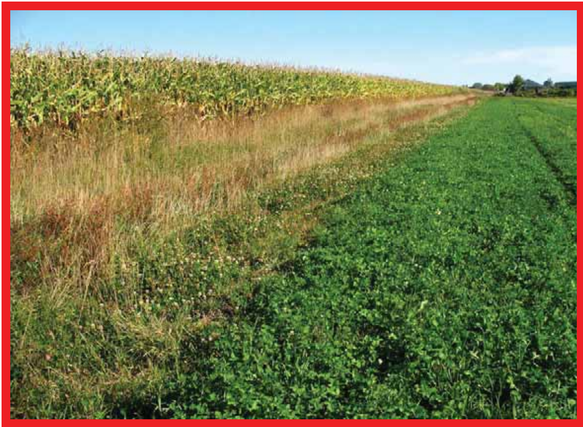
VOIE D'EAU ENGAZONNÉE ACHEMINANT SÉCURITAIREMENT LE RUISSELLEMENT

Deux réflexes doivent nous guider au niveau des moyens de correction : ralentir le ruissellement de surface à un niveau sécuritaire ou l'intercepter au moyen d'ouvrages hydrauliques.