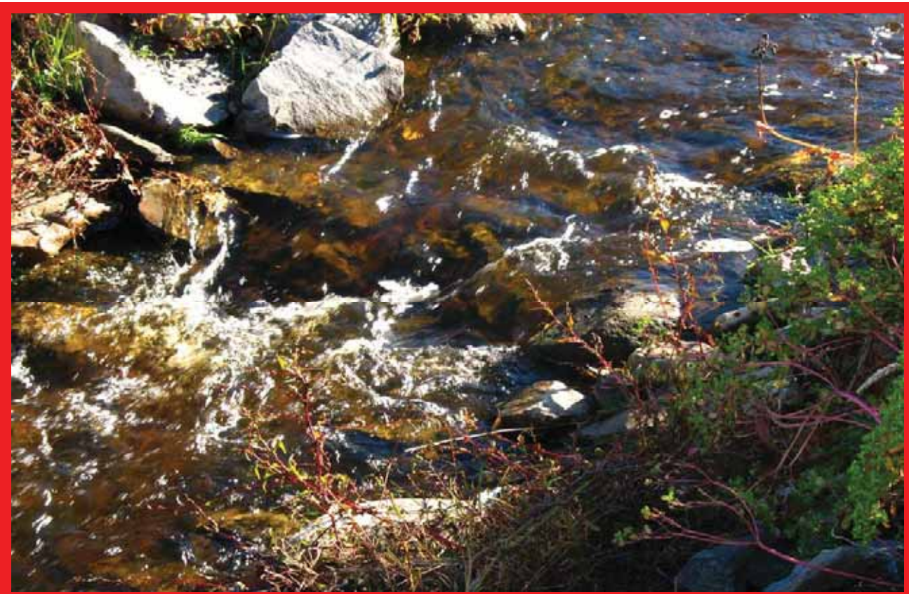
DISSIPATION D'ÉNERGIE ET RÉDUCTION DE VITESSE AU MOYEN DE SEUILS DE PIERRE

On peut protéger le lit d'un cours d'eau sensible à l'érosion en construisant des seuils dissipateurs d'énergie* en vue de réduire la pente longitudinale et les vitesses d'eau. On réduit ainsi les forces de cisaillement qui mettent en mouvement le matériel du lit.