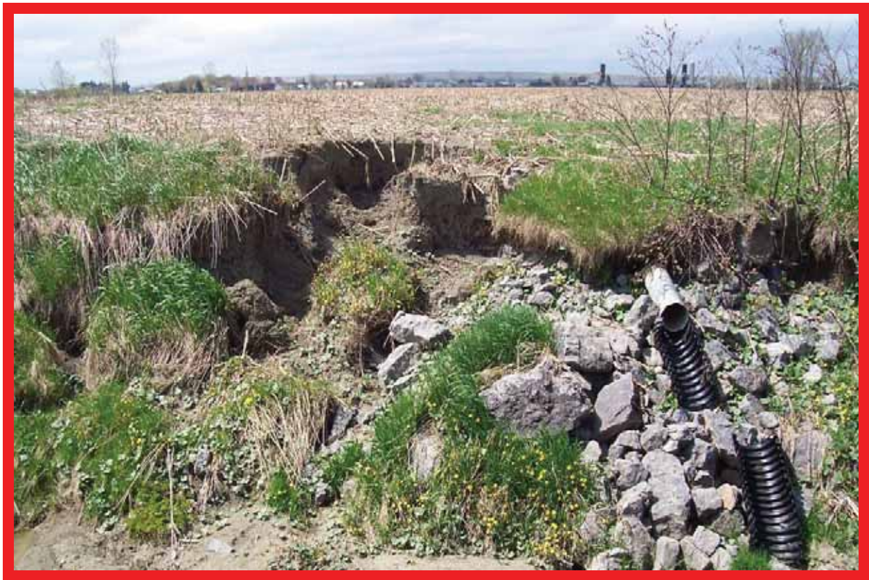
ÉROSION DE LA BERGE PAR CONCENTRATION DE DÉBIT ET RAVINEMENT

Deux réflexes doivent nous guider au niveau des moyens de correction : intercepter le ruissellement de surface ou protéger la confluence du champ et du cours d'eau par un perré.