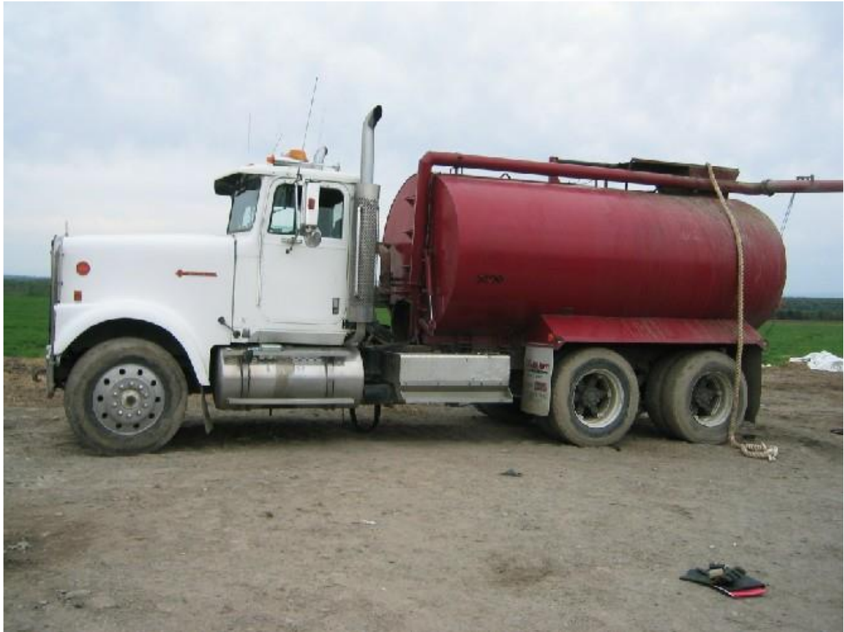
Figure 1 – Le camion-citerne